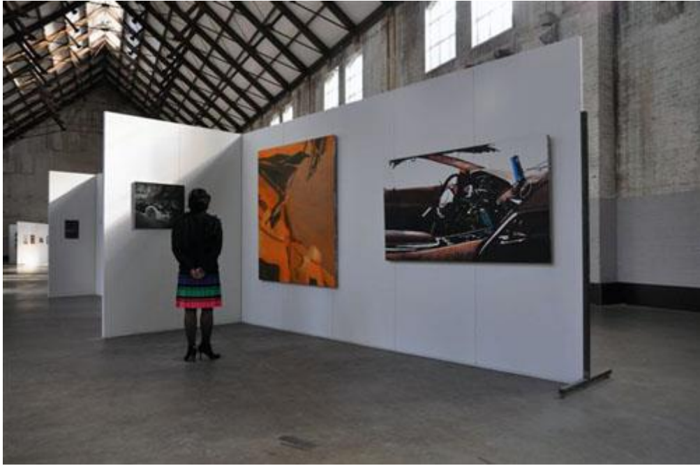
En ook de schilderijen van Sander Cedee (genomineerd)