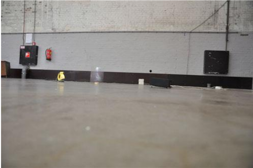
Edwin Deen (winnaar)