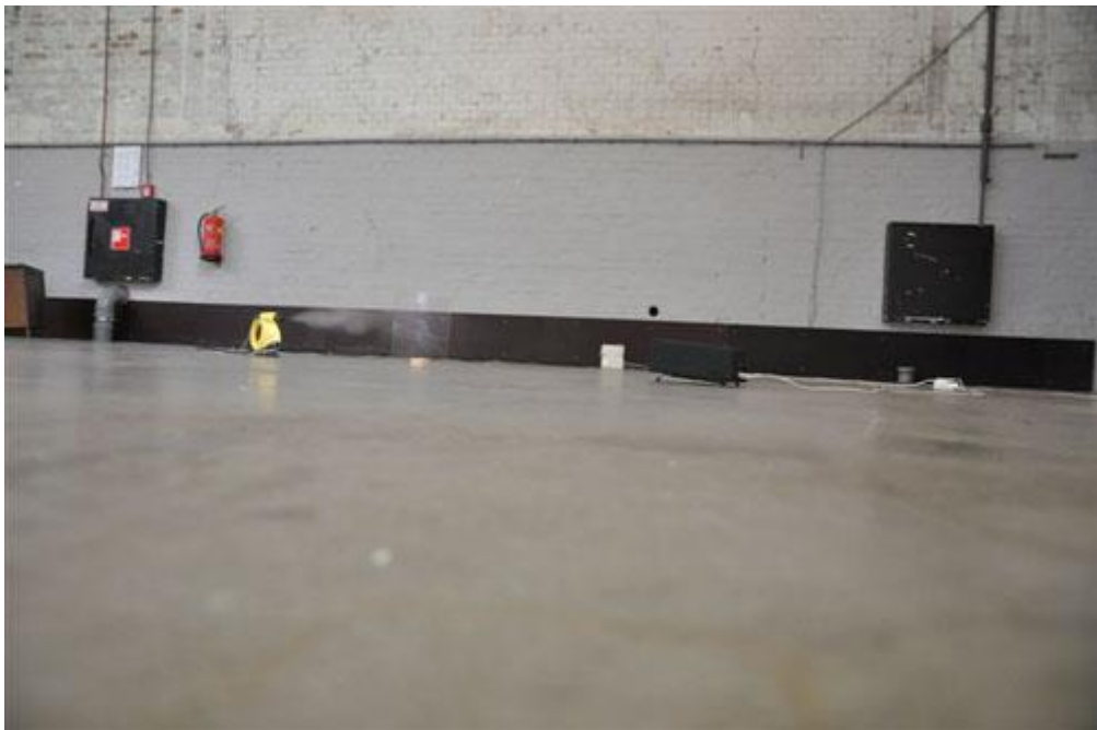
Edwin Deen (winnaar)