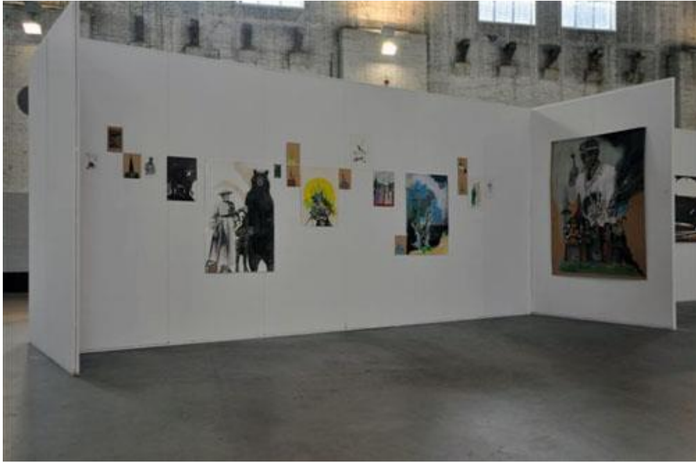
Mirka Farabegoli (genomineerd)